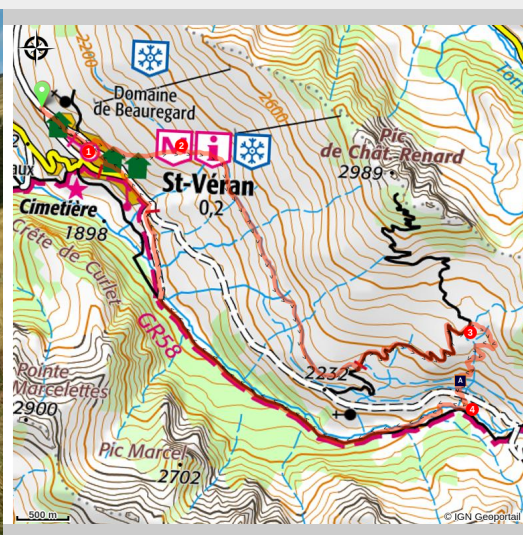
Arrivée sur Saint Véran

Dalla preistoria ai giorni nostri questo percorso ci propone un viaggio nel tempo tracciando la relazione tra l'uomo e la montagna.